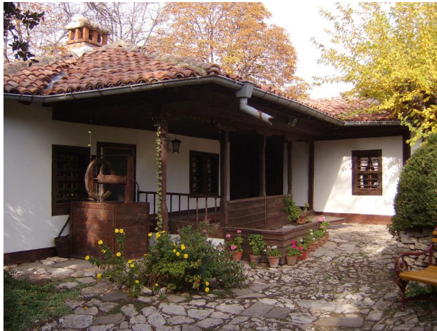
Къща музей на Яворов в Чирпан

За краткия си драматичен живот творецът създава забележителни произведения в трите литературни рода. Освен на поетическите книги „Стихотворения“ (1901), „Безсъници“ (1907) и „Подир сенките на облаците“ (1910), Яворов е автор на биография на Гоце Делчев и спомени за Македония – „Хайдушки копнения“, както и на две драми – „В полите на Витоша“ и „Когато гръм удари, как ехото заглъхва“.